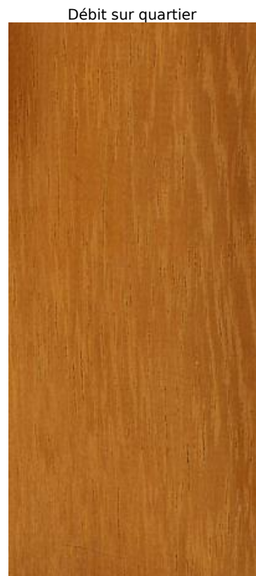
Débit sur quartier