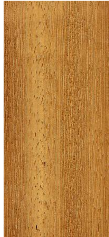
Débit sur dosse